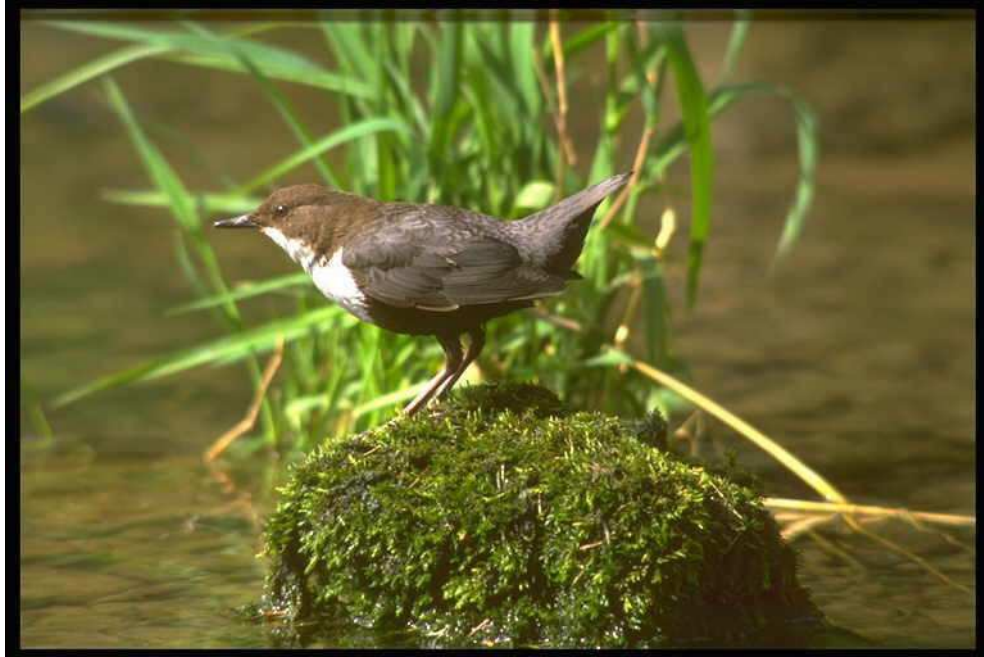
Wasserramsel (Cinclus cinclus)

Kennzeichen: Dunkelbraunes Gefieder mit weißer Brust; kennzeichnendes Knicksen; taucht zur Nahrungssuche; beide Geschlechter gleich.